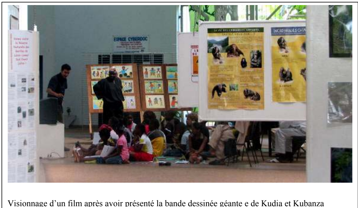
Visionnage d'un film après avoir présenté la bande dessinée géante de Kudia et Kubanza

Après cette visite, un concours de narration était proposé aux classes : les 3 premières classes produisant la plus belle histoire relative à la conservation des grands singes seraient récompensées via la distribution d'un petit cadeau pour chaque élève.